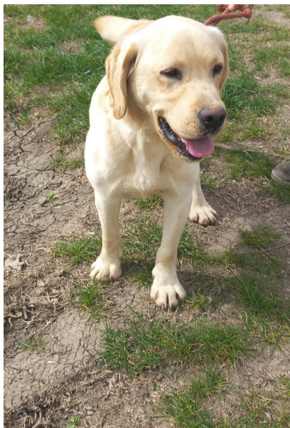
Labrador-Retriever-Mix-Rüde GROM, 5 Jahre, Größe 50 cm, Gewicht 30 kg

HUNDE wollen leben - ZVR: 1962496144 / Wien - Österreich