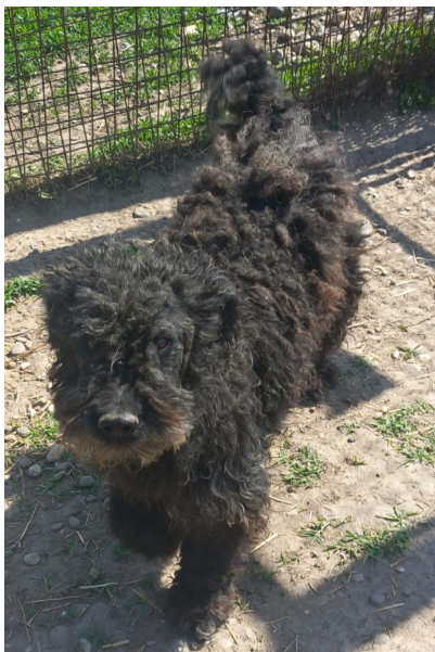
Pudel-Mix-Rüde CUPI, 8 Jahre, Größe 50 cm, Gewicht 12 kg

Kontoverbindung: IBAN: AT672011185097602900 BIC: GIBAATWWXXX