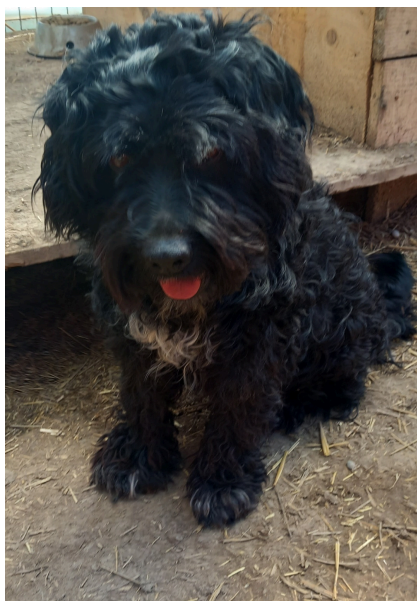
Pudel-Mix-Rüde ROKI, 8 Jahre, Größe 50 cm, Gewicht 25 kg

Der bildschöne Pudel-Mix-Rüde ROKI, 8 Jahre, ist verträglich mit jedem Hund und sehr freundlich mit Menschen, ein lieber Bub mit einem wunderbaren, unkomplizierten Wesen! Bitte weit teilen. Danke!