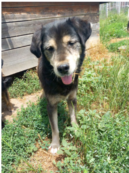
Rüde DEDA, geboren 2014, Größe 60cm, Gewicht 30kg

DEDA ist verträglich und sehr freundlich mit Hunden und Menschen. Der Opa ist keine Schlaftablette, er ist sehr aktiv, liebt Rennen und Spielen.