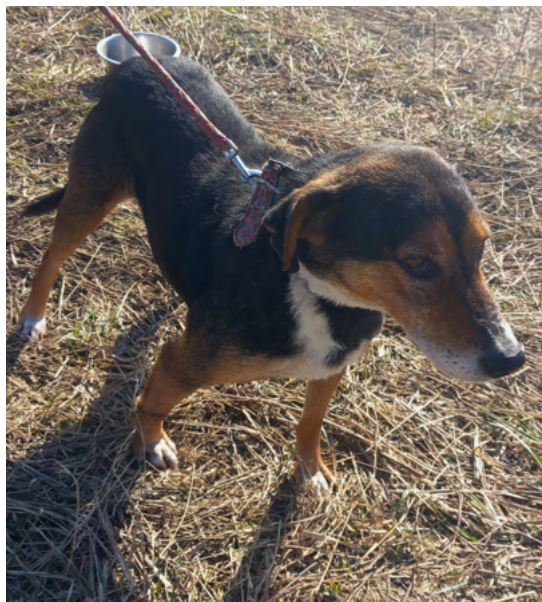
Rüde MAX, geboren 2014, Größe 50cm, Gewicht 18kg

MAX ist verträglich und sehr freundlich mit Hunden und Menschen und trotz seines Alters ist er fit und voller Lebensfreude. Auch mit Kindern weiß er umzugehen.