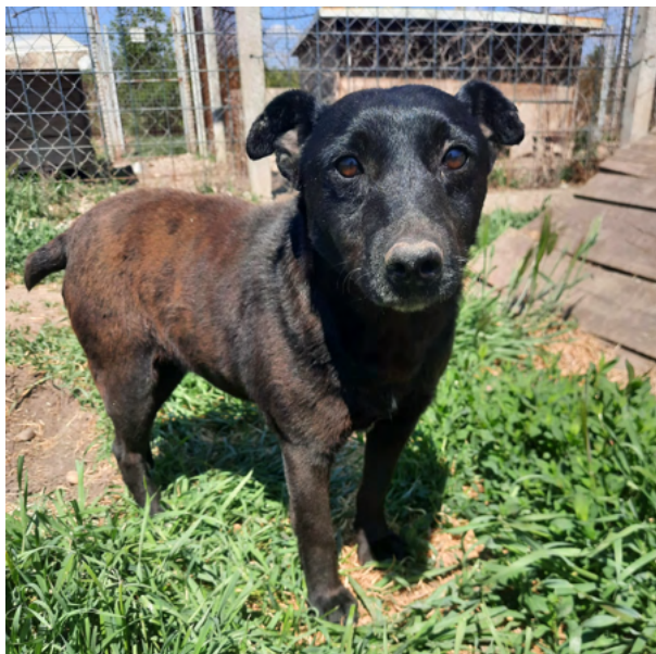
Dackel-Mix-Hündin INDIRA, geboren 2016, Größe 40cm, Gewicht 12kg

INDIRA ist verträglich und sehr freundlich.