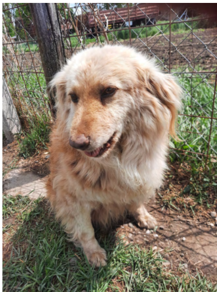
Dackel-Golden-Retriever-Mix-Rüde KINEZ, geboren 2018, Größe 40cm, Gewicht 15kg

KINEZs dickes Fell lässt ihn größer erscheinen als er ist. Er sieht aus wie ein Mini Retriever, aber mit dem charmanten Augenaufschlag eines Dackels! KINEZ ist verträglich und sehr freundlich mit Hunden und Menschen.