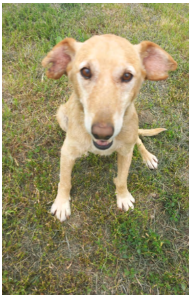
Dackel-Mix-Rüde PAKO, geboren 2015, Größe 45cm, Gewicht 17kg

PAKO ist verträglich und sehr freundlich mit Hunden und Menschen, einfach ein lieber Opi.