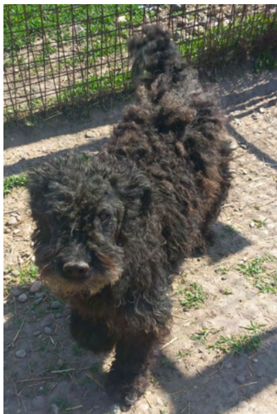
Pudel-Mix-Rüde CUPI, geboren 2017, Größe 50cm, Gewicht 12kg

CUPI ist verträglich und sehr freundlich mit Hunden und Menschen.