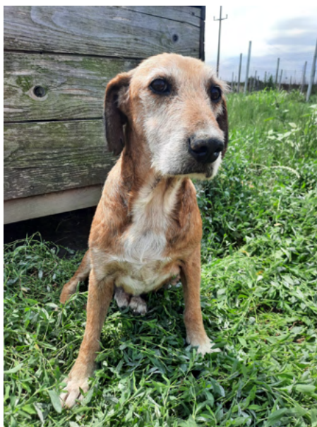
Mischlings-Rüde RALF, geboren 2014, Größe 45cm, Gewicht 15kg

RALF ist verträglich mit jedem Hund und sehr freundlich mit Menschen, ein wahrer Schmuser vor dem Herrn mit unkompliziertem Wesen!