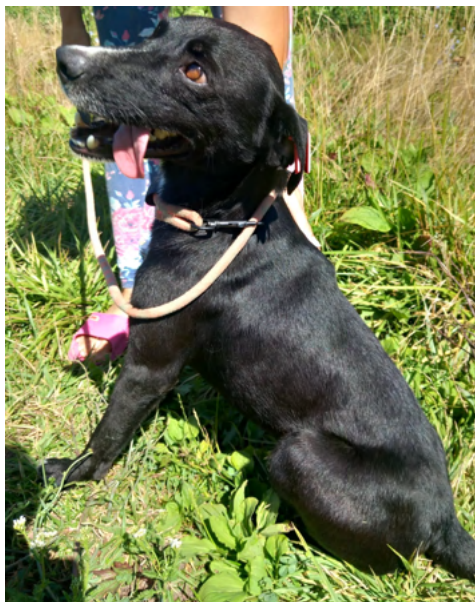
Rüde JUMPER, geboren 2020, Gewicht 10kg, Größe 50cm

JUMPER ist verspielt und agil - und er liebt es gestreichelt zu werden.