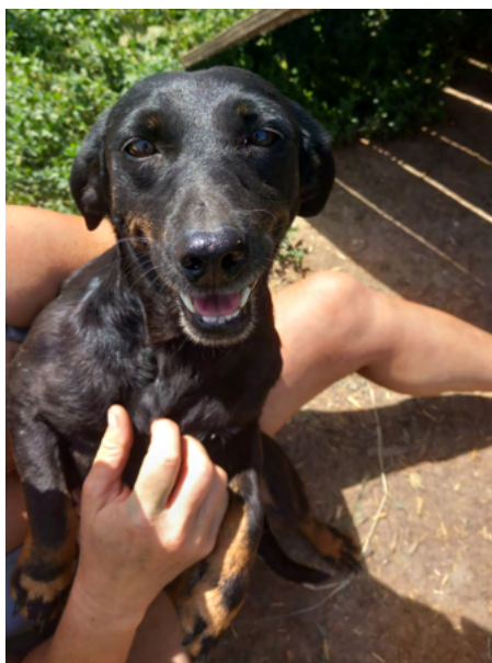
Dackel-Mix-Hündin KLARA, geboren 2019, Größe 40cm, Gewicht 10kg

KLARA ist verträglich und sehr freundlich mit Hunden und Menschen.